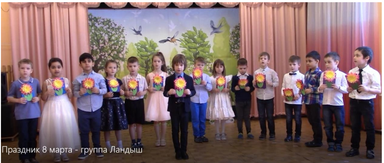
Праздник 8 марта - группа Ландыш