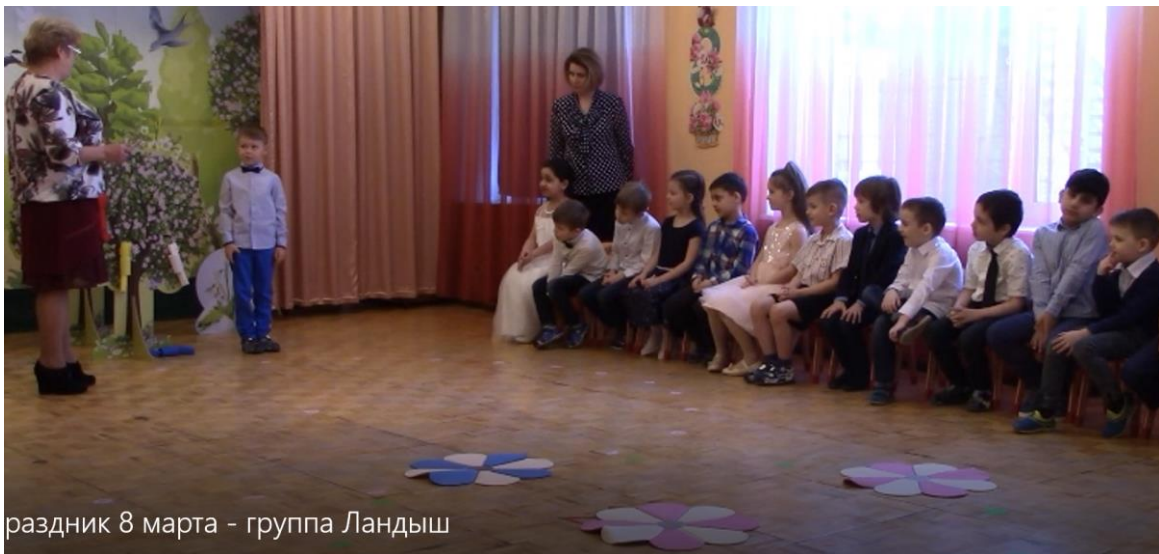
раздник 8 марта - группа Ландыш

Дети берут подарки, встают, говорят хором: «Поздравляем!»